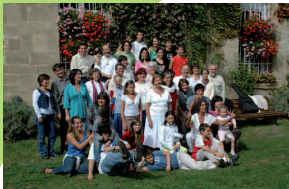
La communauté en septembre 2007