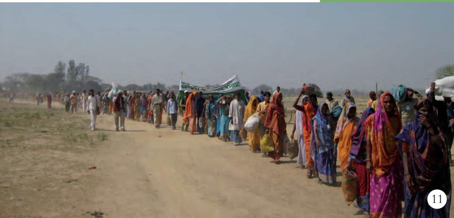
Marche non-violente, Bihar, 2009