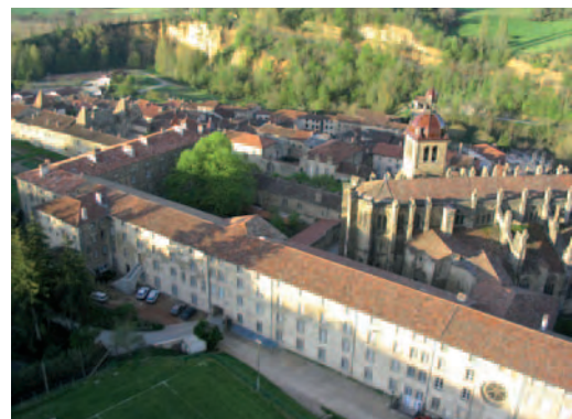
Le village. À gauche, la communauté

Les communautés de l'Arche ont été fondées par Lanza del Vasto en 1948, après sa rencontre avec Gandhi. Des célibataires et des couples y choisissent d'expérimenter une vie communautaire basée sur une recherche de vivre la Non-Violence dans tous les aspects de la vie. Celle-ci est faite de travail, de simplification des besoins, de conciliation et de réconciliation, de prière et d'approfondissement spirituel ainsi que de chants, danses et fêtes. Ils participent à des actions non-violentes pour la justice et la paix, en lien avec d'autres mouvements. Selon Lanza del Vasto, vouloir changer le monde c'est d'abord rechercher à se changer soi-même par une démarche spirituelle, de développement personnel et créatif.