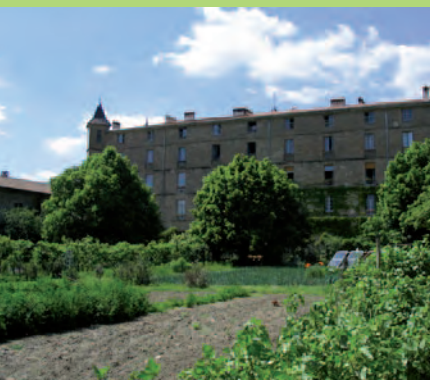
Le jardin et le bâtiment