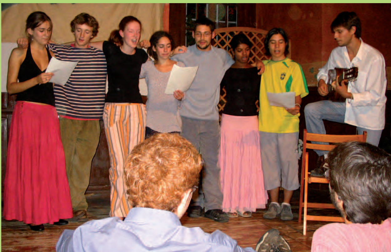
Moment de fête

Pour ceux et celles qui seraient encore en recherche sans projet concret, la FÈVE peut être une occasion de rencontrer des personnes et des lieux sources d'inspiration.